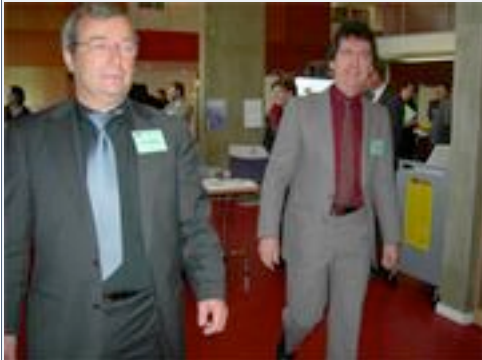
Cravate d'accueil !