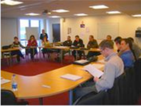
Travail de groupe