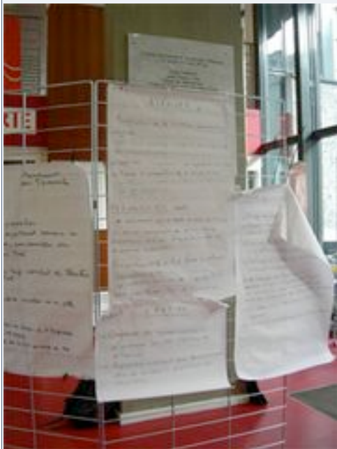
Affiche de réflexion des groupes

Les mails se croisent et se multiplient pour réussir à élaborer une stratégie constructive ! Heureusement les vacances de Février ont