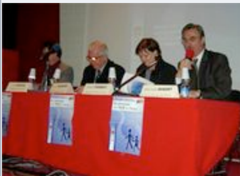
Ouverture du colloque