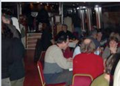
Repas sur la péniche